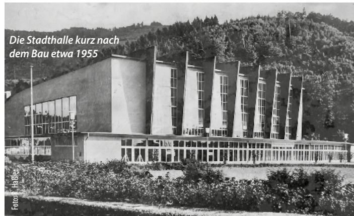
Die Stadthalle kurz nach dem Bau etwa 1955

Die Wiehre und Oberau sind insbesondere durch den Schwerlastverkehr auf der B31 extrem belastet.