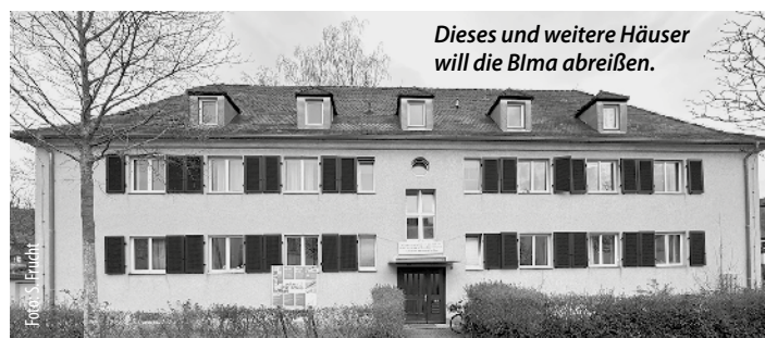
Dieses und weitere Häuser will die Blma abreißen.

ca. 40 % aller CO2-Emissionen und hat 60 % Anteil an unserem Müllaufkommen – ist also ein sehr großer Ressourcenverbraucher und Emittent. Sanieren im Bestand, wo immer möglich, wäre der Königsweg, um Ressourcen einzusparen und die Vernichtung von grauer Energie zu vermeiden. Die Häuser in der August-Ganter-Straße 5-9 stehen beispielhaft für einen nicht zeitgemäßen Umgang mit dieser Problematik, leider bisher mit tätiger Mithilfe der Stadt. Es gibt Lösungsvorschläge, wie fast genauso viel Wohnraum durch Nachverdichtung und Sanierung im Bestand erreicht werden kann und die zudem noch finanziell günstiger sind. Wir wünschen uns eine kraftvolle Intervention des Oberbürgermeisters, die alle Akteure – Bundesanstalt für Immobilienangelegenheiten, Stadtplanungsamt, betroffene Mieter:innen und die bereits involvierten Planer:innen – an einen Tisch holt und eine zukunftsgerichtete Lösung unter Vermeidung von Ressourcenverbrauch