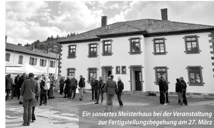
Ein saniertes Meisterhaus bei der Veranstaltung zur Fertigstellungsbegehung am 27. März

■ Mit diesem Motto wurden wir Besucher:innen von der Freiburger Stadtbau zur Begehung der frisch sanierten Meisterhäuser eingeladen, dem Bauabschnitt 3 der Knopfhäusle-Siedlung. Jeweils acht Zweizimmerwohnungen pro Haus gruppierten sich ursprünglich um einen Innenhof. Wir konnten eine der durch Zusammenlegung entstandenen, jetzt 110qm großen Maisonette-Wohnungen, besichtigen. Interessant war zu erfahren, dass diese Häuser im Gegensatz zu den vorher sanierten Reihenhäusern von innen isoliert werden mussten.