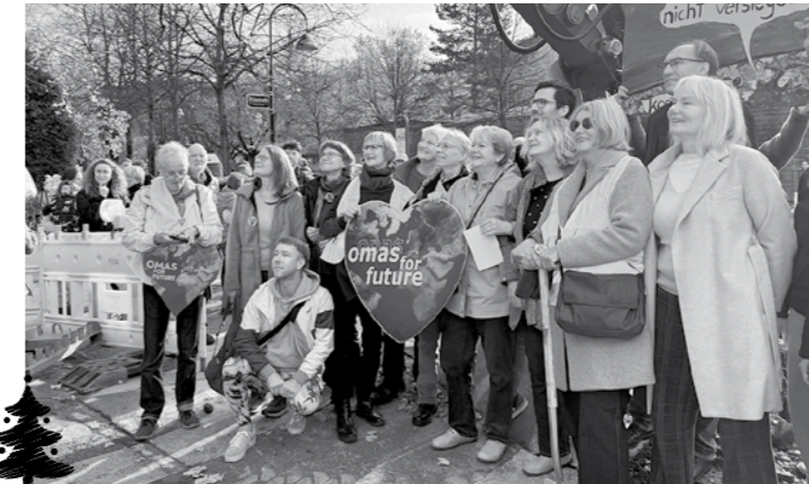
Spatenstich mit OB Horn, Baubürgermeister Haag, Vertreter:innen von Omas und Opas for Future und dem Bürgerverein

■ Mit dem Spatenstich am 31.10.2025 begann die Entsiegelung der Asphaltfläche an der Ecke Urachstr./Hildastr., am Alten Wiehrebahnhof; ein Projekt, das weit mehr bedeutet als nur eine Baustelle. Im Zuge unseres Einsatzes für ein verbessertes Stadtklima bei steigenden Temperaturen und deren gesundheitlichen Belastungen haben wir, die „Omas/Opas for Future“ aus Freiburg, mit einer „etwas provokanten“ Aktion im Juli letzten Jahres Entsiegelung und Begrünung gefordert. Dabei färbten wir die Asphaltfläche zur Anschauung grün ein. Diese Aktion wurde von vielen sehr positiv aufgenommen und unterstützt – über 120 Unterschriften sind im Laufe eines einzigen Vormittags zusammengekommen! Nach mehreren konstruktiven Absprachen mit der Stadt Freiburg, bis hin zum Oberbürgermeister Martin Horn und Baubürgermeister Prof. Dr. Martin Haag - haben wir erreicht, dass diese Fläche jetzt entsiegelt und begrünt wird. Die Stadt schafft die Voraussetzungen im Rahmen von „Freiburg packt an“, die Omas for