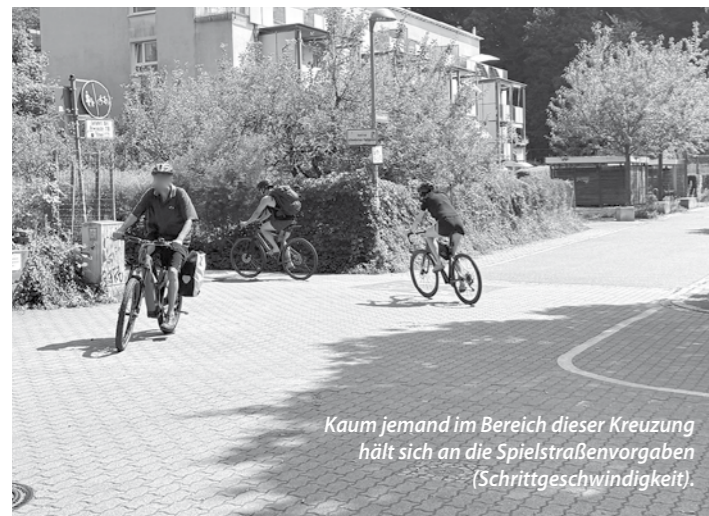
Kaum jemand im Bereich dieser Kreuzung hält sich an die Spielstraßenvorgaben (Schrittgeschwindigkeit).

se Urachstraße, Peter-Sprung-Straße-Birnenwegle hinweist: „Das viel zu kleine Nadelöhr des Radweges - „Birnenwegle“ - setzt die Problematik in Richtung Osten fort. Dort verschärft sich die Situation und führt regelmäßig zu sehr gefährlichen Situationen und Aggressionen zwischen den Verkehrsteilnehmern.“ BV