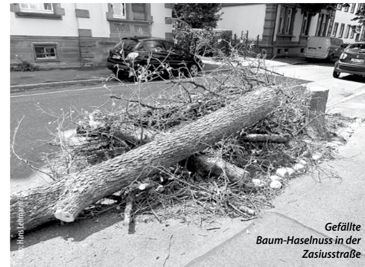
Gefällte Baum-Haselnuss in der Zasiusstraße

Die Baumhasel vor unserem Haus, die von uns in den heißen Sommermonaten immer mit Wasser versorgt wurde, wuchs zunächst gut heran. Sie trug in den vergangenen Jahren reichlich Haselnüsse. Vor ca. fünf Jahren begann das Absterben von Ästen, letztes Jahr blieben die Haselnüsse gänzlich aus, dieses Jahr auch der Grünbewuchs. Am 28. Juli dieses Jahres rückte das Fäll-Team der Stadt Freiburg an, keine Stunde später sah der Baum so aus, wie es auf dem Foto zu sehen ist. Nach einer