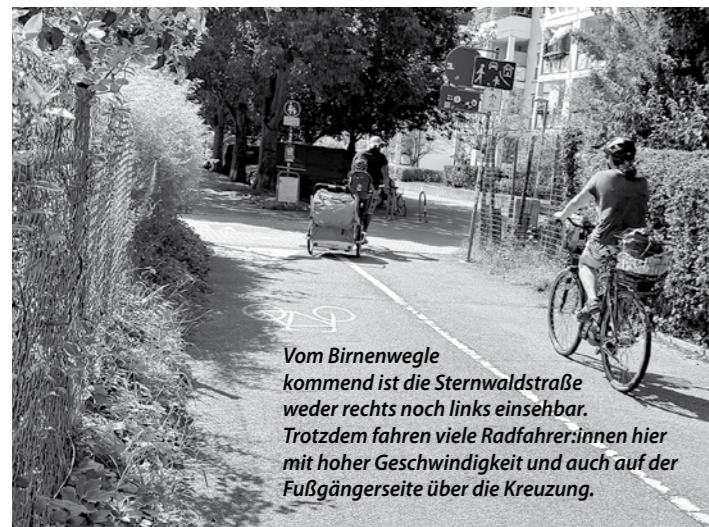
Vom Birnenwegle kommend ist die Sternwaldstraße weder rechts noch links einsehbar. Trotzdem fahren viele Radfahrer:innen hier mit hoher Geschwindigkeit und auch auf der Fußgängerseite über die Kreuzung.