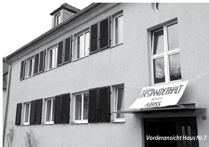
Vorderansicht Haus Nr.7

Solche Angebote sind auch im privaten Wohnungsmarkt nicht immer üblich und werden von der Mieterschaft grundsätzlich begrüßt. Allerdings basiert ein Aufhebungsvertrag auf Freiwilligkeit beider Parteien und kennt in der Regel keine Fristsetzung. Die BImA setzt jedoch alles daran, die Zustimmung der Mieter:innen unter Druck zu erreichen, indem sie ihnen eine Frist von nur vier Wochen zur Einwilligung gibt. Wer einem Aufhebungsvertrag zustimmt, verzichtet auf die Möglichkeit, die Rechtmäßigkeit der Kündigung gerichtlich überprüfen zu lassen.