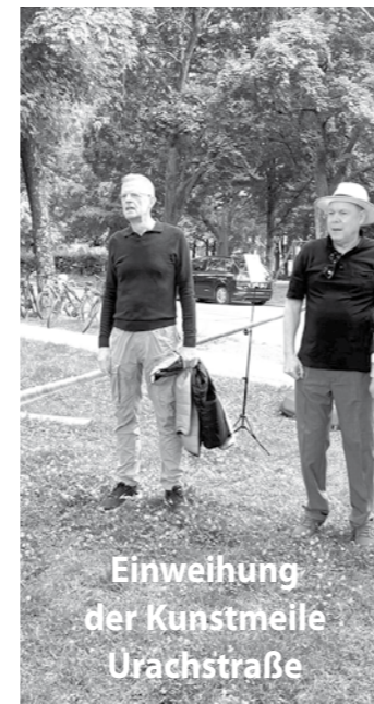
Einweihung der Kunstmeile Urachstraße

Älterwerden ist nicht „verlorene Jugend“, sondern ein neues Stadium von Möglichkeiten und Stärke. Betty Friedan