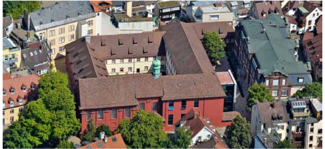
Die Nonnen von Adelhausen, einst in der Wiehre beheimatet, ließen 1687 bis 1694 das Adelhauser Kloster bauen. Seit 2013 ist das Gebäude Sitz der Stiftungsverwaltung Freiburg.

schaftlicher Teilhabe sowie Bildung für jemanden eingeschränkt, ist das auch Armut“, sagt sie und ergänzt: „Schön, dass es zum Beispiel den Armenfonds der Waisenhausstiftung gibt.“ Dieser Fonds war früher eine tragende Säule des städtischen Fürsorgewesens.