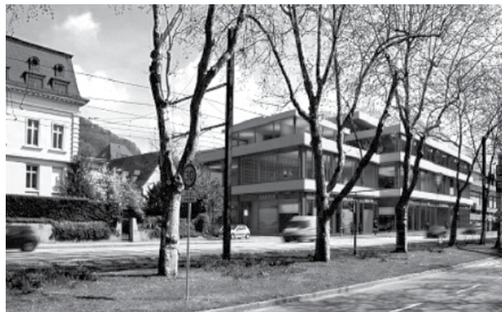
Entwurfsplanung einer möglichen Ansicht eines Folgebaus des heutigen Flaschenkellers.

Im ersten Jahr seines Betriebes hat das Ballhaus mehr Besucher empfangen als Freiburg Einwohner hat. Eine stolze Bilanz.