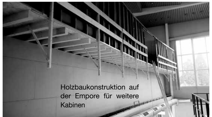
Holzbaukonstruktion auf der Empore für weitere Kabinen