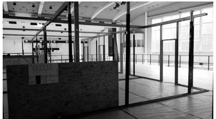
Dachboden des Stahlskeletts für weitere geschlossene Kabinen