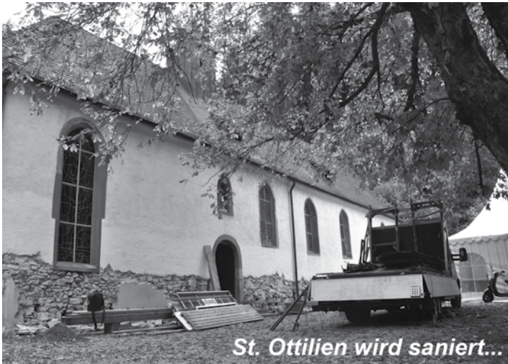
St. Ottilien wird saniert...