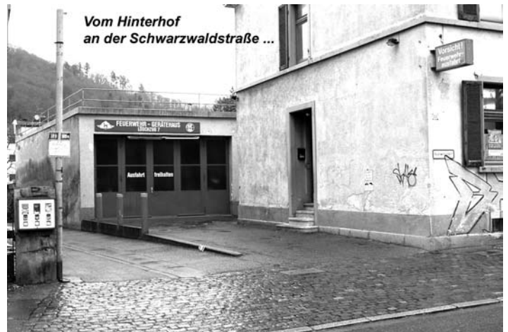
Vom Hinterhof an der Schwarzwaldstraße ...

Das Straßenbahndepot an der Urachstraße hat in seiner über hundertjährigen Geschichte üb-