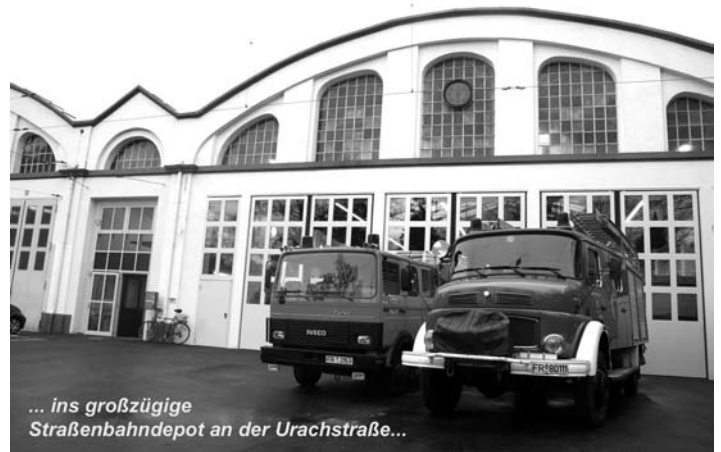
... ins großzügige Straßenbahndepot an der Urachstraße...

rigens schon andere Zweckentfremdungen und dabei geradezu historische Momente erlebt. In der unmittelbaren Nachkriegszeit, als es (vor dem Bau der Stadthalle) in Freiburg keinen unversehrten großen Versammlungsbau gab, waren die wun-