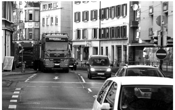
Der alltägliche Wahnsinn in Sachen Straßenverkehrslärm spielt sich in der unteren Schwarzwaldstraße ab – vor allem nachts ist er hier so unerträglich wie wohl sonst nirgendwo im ganzen Stadtgebiet. Aussicht auf spür- und hörbare Besserung bietet jetzt der „Lärmaktionsplan“; der sieht als eine zentrale Maßnahme – zunächst als Probelauf – nächtliche Tempobegrenzungen auf 30 km/h vor – auch auf dem innerstädtischen Abschnitt der B31.

vorrangig auf eine Verringerung der Lärmbelastungen an vielbefahrenen Straßen. Die vorangegangene „Lärmkartierung“ – also eine Bestandsaufnahme der tatsächlichen Belastungen durch Verkehrslärm – hatte nichts Überraschendes zu Tage gefördert: Wo es in Freiburg am lautesten ist, wusste man auch schon vorher – kein Wunder also, dass innerstädtisch die Dreisamuferstraßen und v.a. die untere Schwarzwaldstraße zu den „verlärmtesten“ Stellen im ganzen Stadtgebiet gehören (übrigens auch zu denen mit der schlechtesten Luftqualität...). Die wirksamste und preiswerteste der realistischen Gegenmaßnahmen ist eine deutliche Geschwindigkeitsbegrenzung gerade auf den stark befahrenen Durchgangsstraßen, und dies eben vor allem in der Nacht. Dem steht natürlich die von vielen für unantastbar gehaltene „Flüssigkeit und Leichtigkeit des Verkehrs“ entgegen. Die GRÜNEN fordern mit Nachdruck, dass dieser klassische Zielkonflikt endlich zugunsten der Menschen und ihrem nächtlichen Ruhebedürfnis entschieden werden muss. Eine Schlüsselrolle dürfte dabei dem Regierungspräsidium (RP) zufallen, das sich ja in Freiburg zuletzt insbesondere bei Verkehrsthemen nicht gerade