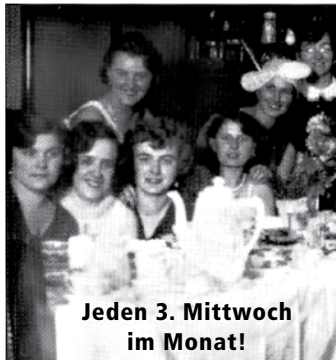
Jeden 3. Mittwoch im Monat!

Das Sommerferienprogramm kann im Büro abgeholt werden